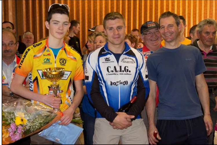
Le 14 avril 2013 Course cycliste organisée par le RS10.