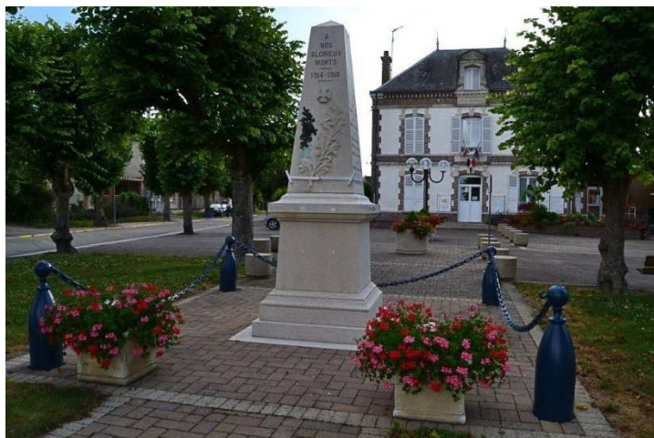
Remise en état du Monument aux Morts.