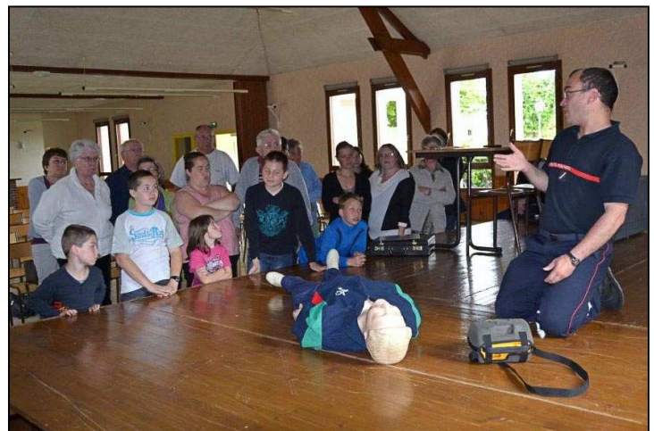
Démonstration du défibrillateur par le Centre de Secours de Marigny le Châtel.