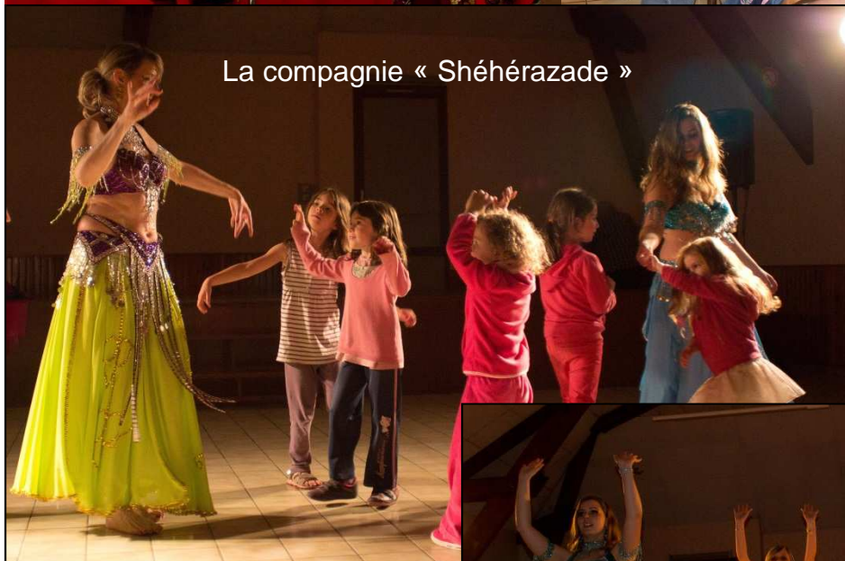
La compagnie « Shéhérazade »

Le 15 juin 2013 Spectacle de clowns, danse orientale et feu organisés par le Comité des Fêtes.