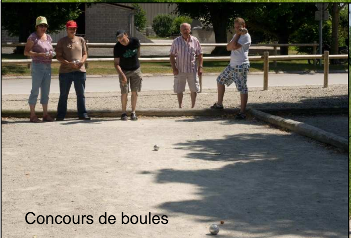
Concours de boules