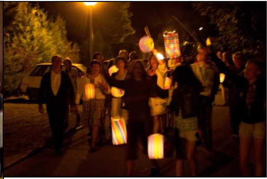
Plateau repas offert par la Municipalité, retraite aux flambeaux suivis d'une soirée dansante.