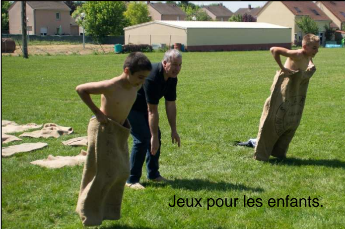
Jeux pour les enfants.